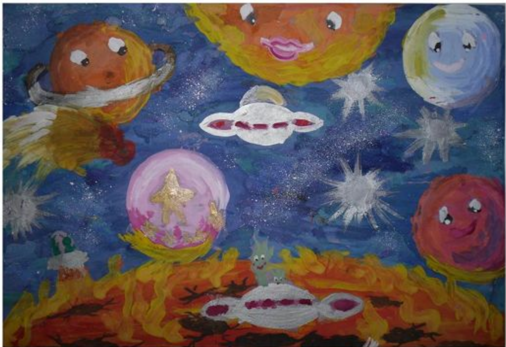
Улыбка солнечной системы О.Скорик (7 лет) ГБОУ школа №331 Санкт-Петербург