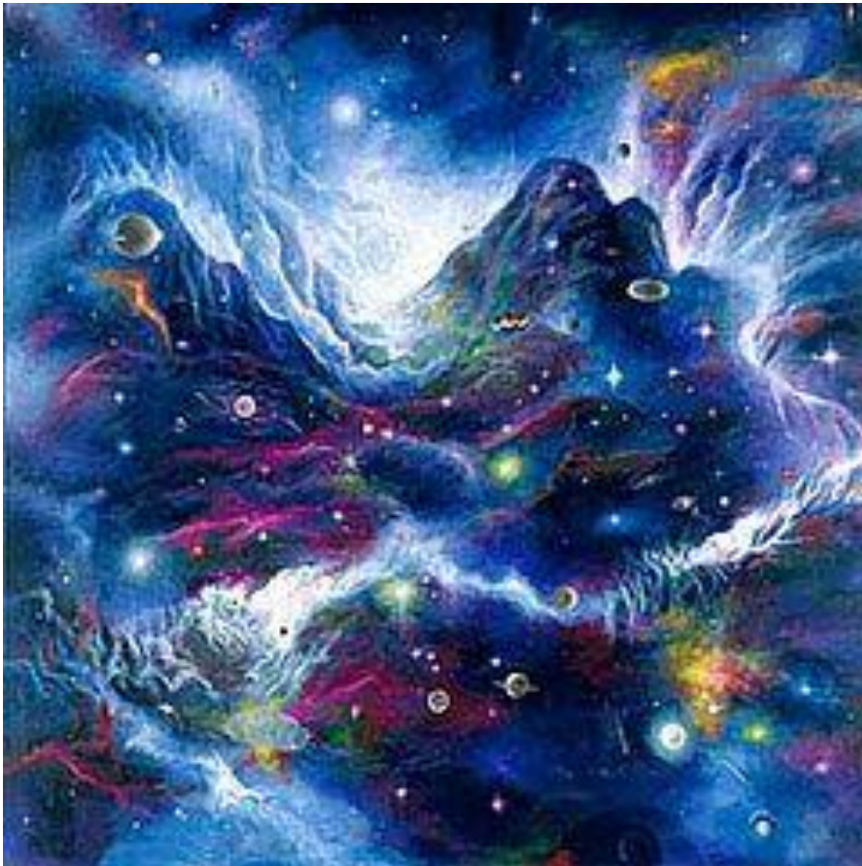
«Сотворение». Акиане Крамарик. 10 лет