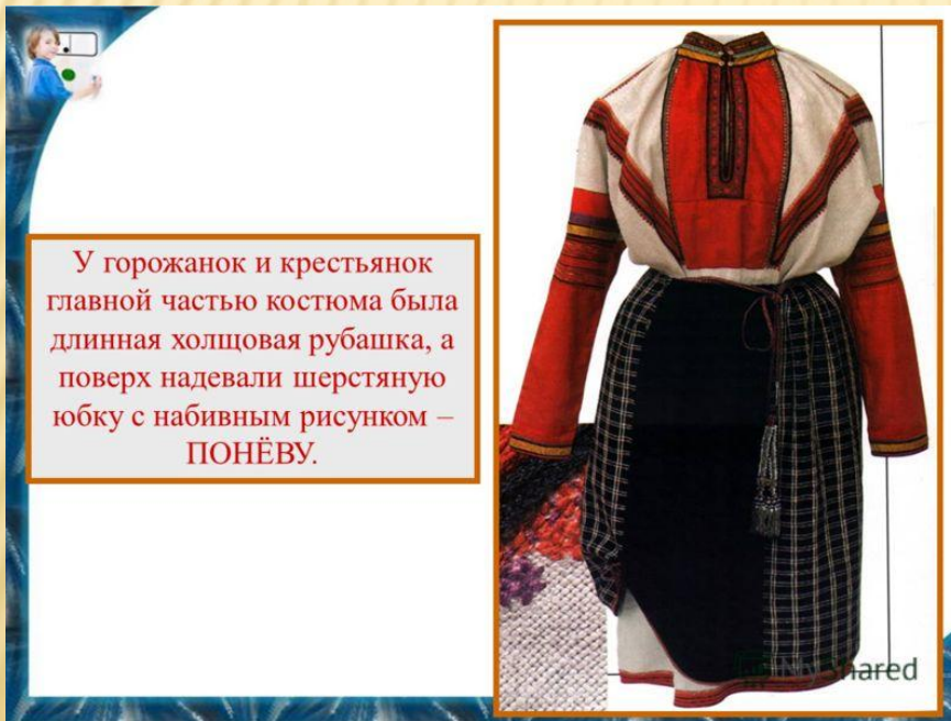
У горожанок и крестьянок главной частью костюма была длинная холщовая рубашка, а поверх надевали шерстяную юбку с набивным рисунком – ПОНЁВУ.

Основным элементом женской одежды была льняная или полотняная рубашка, поверх которой надевали длинный сарафан с пуговицами и душегрею – короткую кофту с рукавами или без них. На ногах были лапти. Зимой женщины, как и мужчины, носили овчинные шубы. Особое значение имел головной убор: незамужние девушки удерживали свои косы повязкой, а замужние женщины прятали волосы под особую шапочку – волосник, а поверх надевали платок.