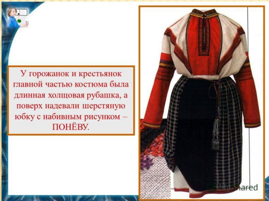
У горожанок и крестьянок главной частью костюма была длинная холщовая рубашка, а поверх надевали шерстяную юбку с набивным рисунком – ПОНЁВУ.

Основным элементом женской одежды была льняная или полотняная рубашка, поверх которой надевали длинный сарафан с пуговицами и душегрею – короткую кофту с рукавами или без них. На ногах были лапти. Зимой женщины, как и мужчины, носили овчинные шубы. Особое значение имел головной убор: незамужние девушки удерживали свои косы повязкой, а замужние женщины прятали волосы под особую шапочку – волосник, а поверх надевали платок.