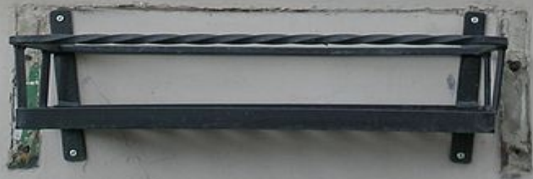
Мемориальная доска на ул. Ивана Черных