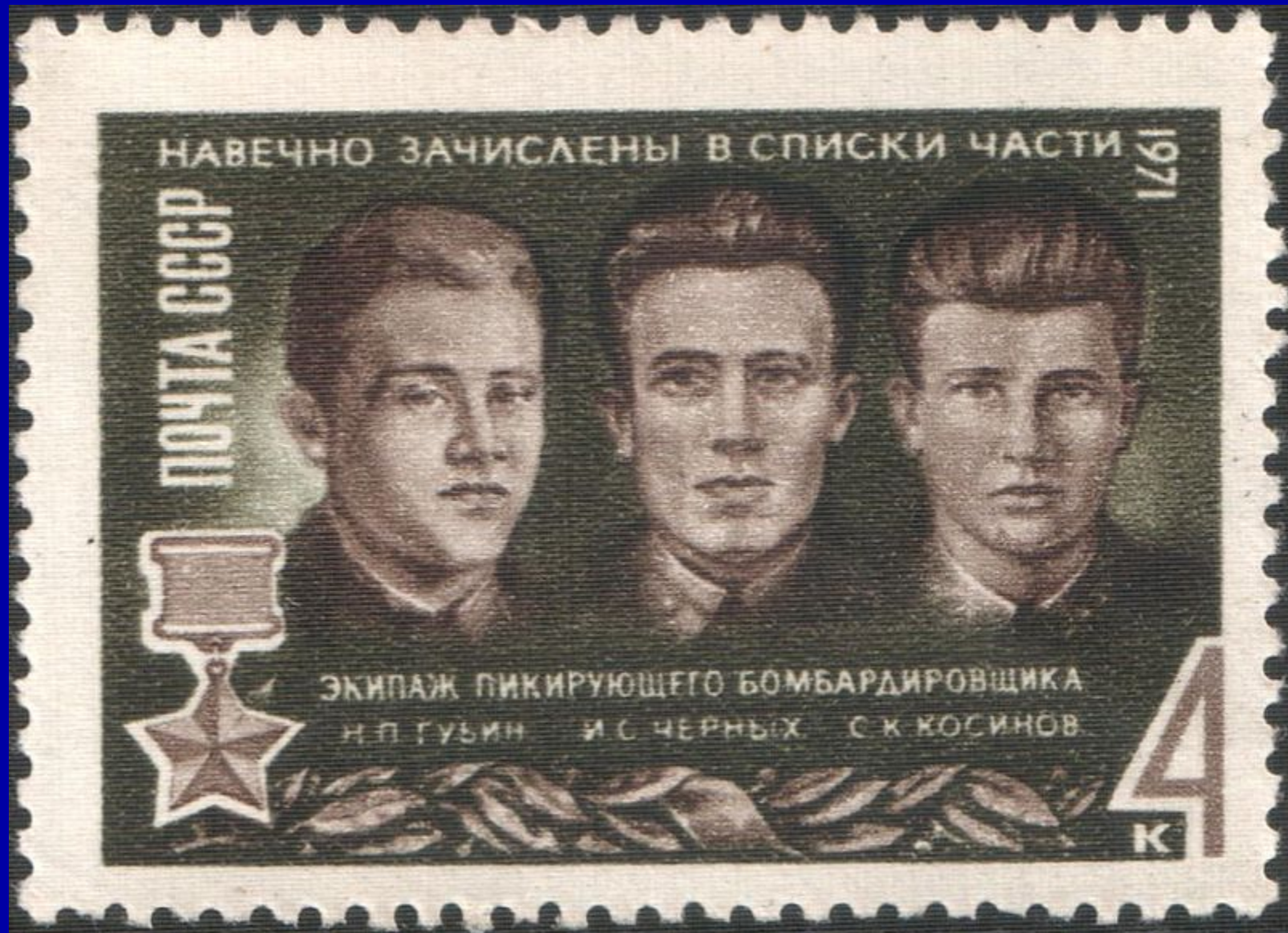
Назар Губин, Иван Черных и Семён Косинов на марке Почты СССР, 1971 год