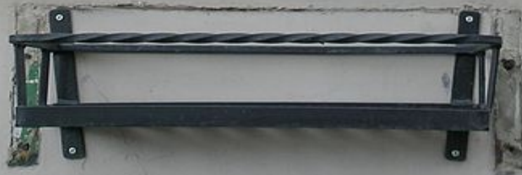
Мемориальная доска на ул. Ивана Черных