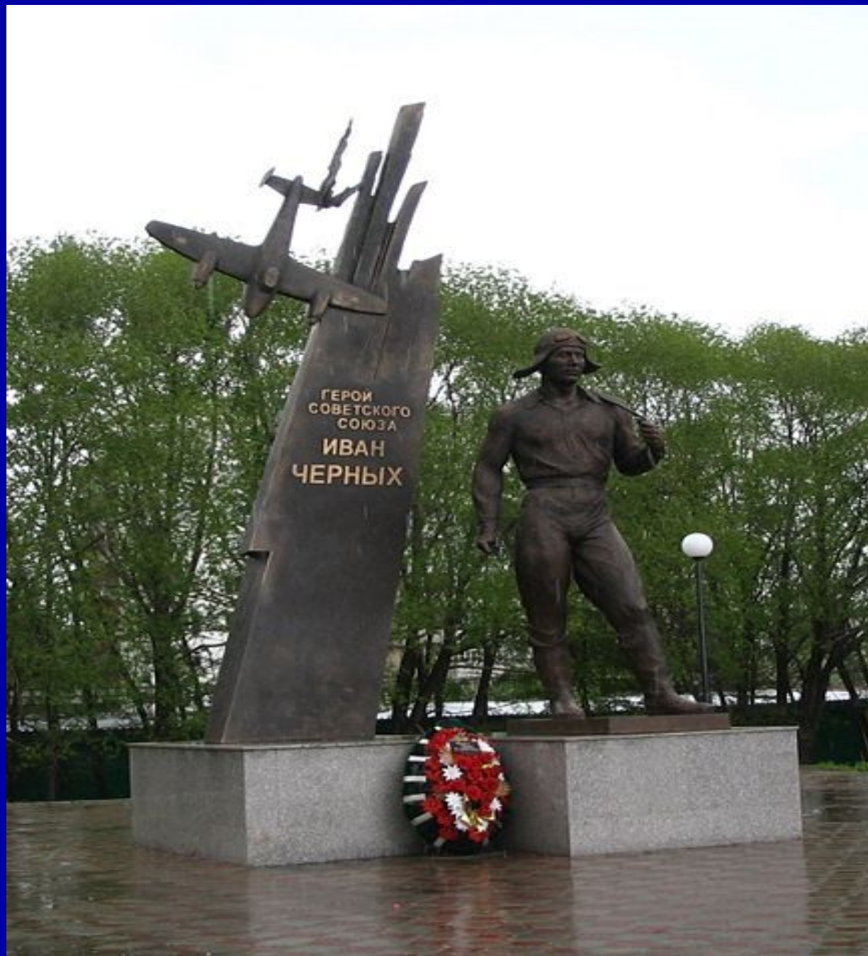
Памятник Ивану Черных в Томске