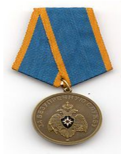
Медаль за безупречную службу в МЧС