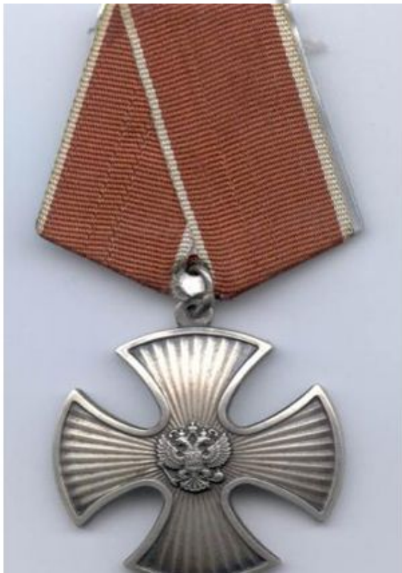
Медаль за безупречную службу в МЧС