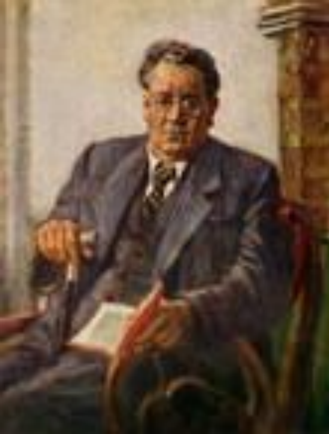
САМУИЛ ЯКОВЛЕВИЧ МАРШАК