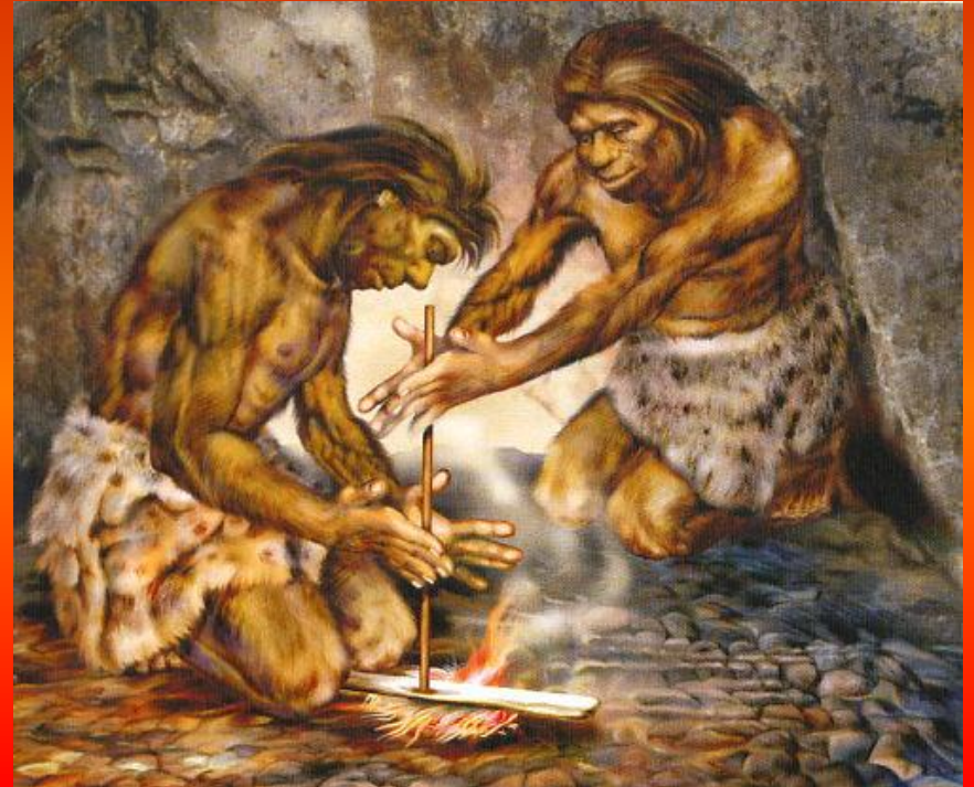
Древние люди у огня.