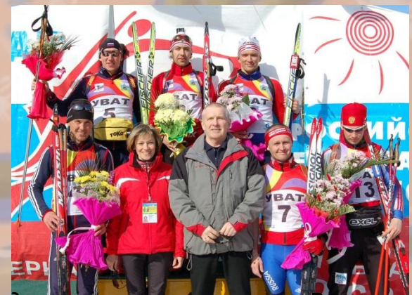
Награждение призеров чемпионата России по биатлону 2008 год, тюменская область, Уват.