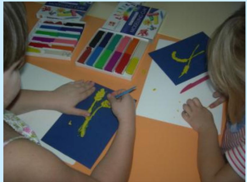
Лепка «Хлебный колосок»