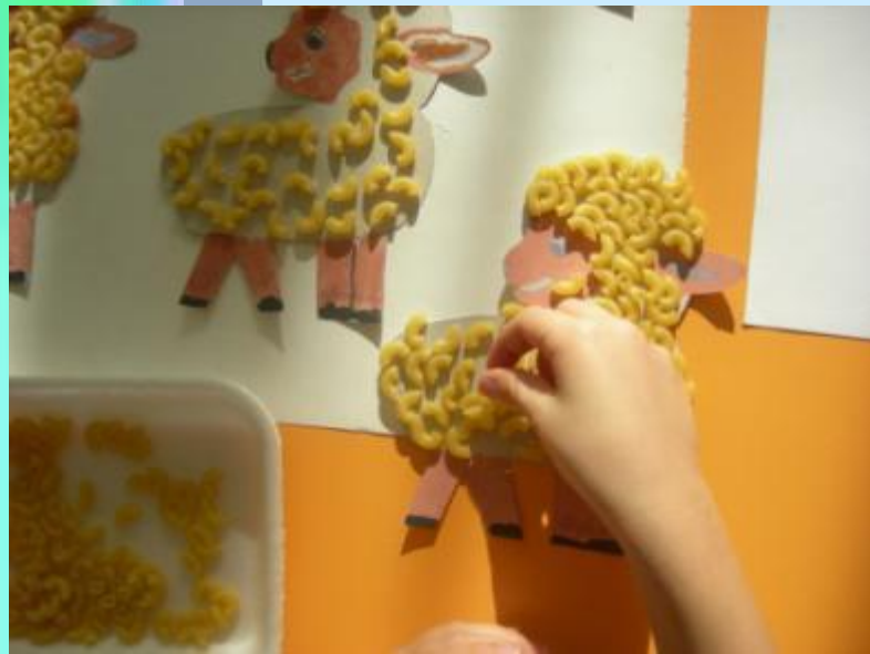
Коллективная аппликация «Барашки на лугу»