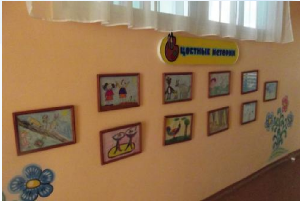
Выставка рисунков детей