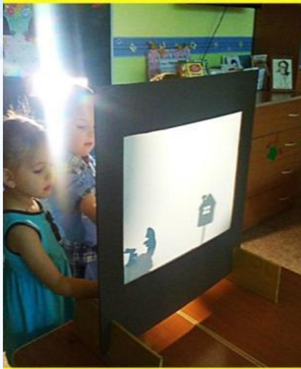
Театральная студия «Солнышко»