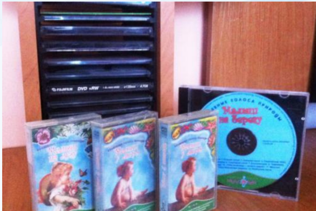
Аудио и видео коллекции