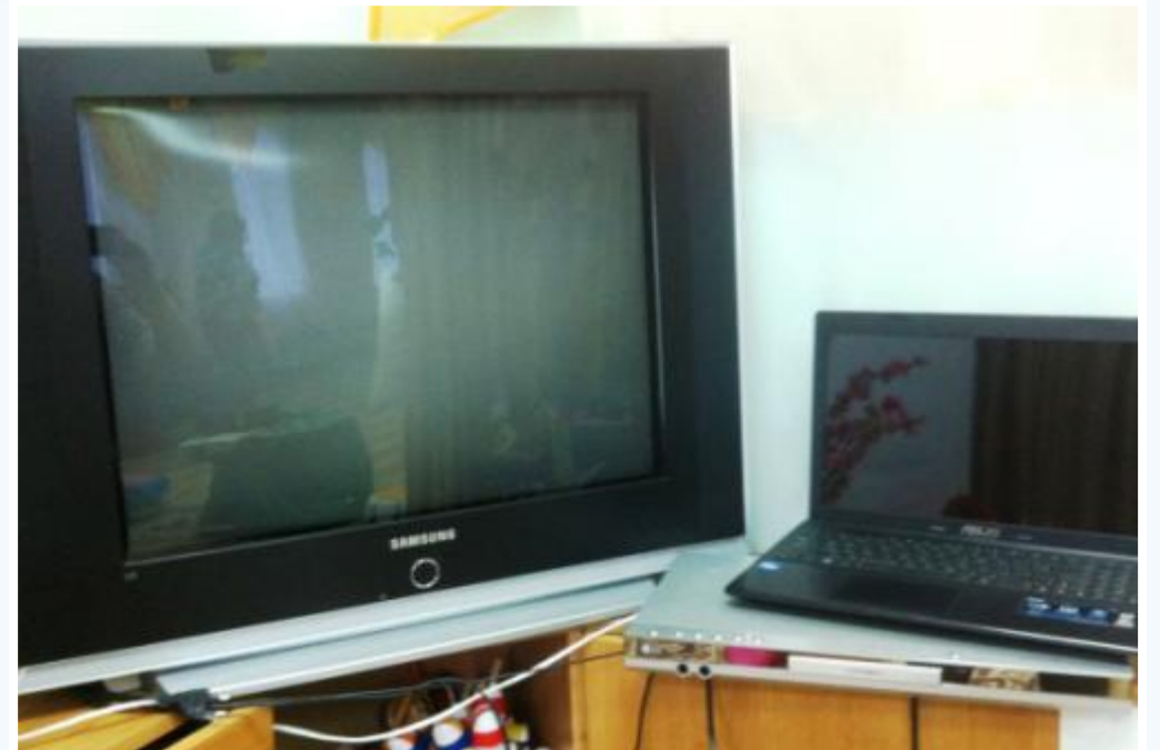
Аудио и видео аппаратура