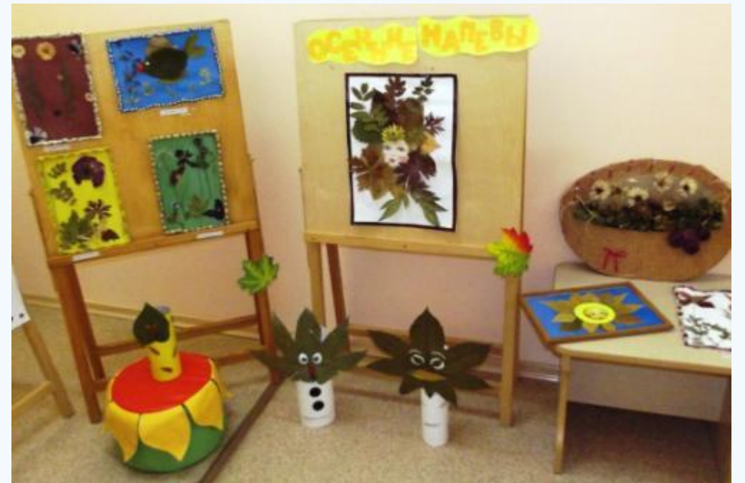
Выставка поделок изготовленных детьми