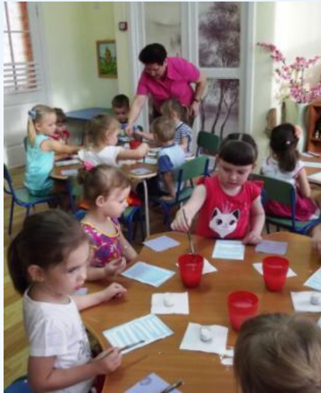
Кружок рисования «На крыльях фантазии в мир образов»