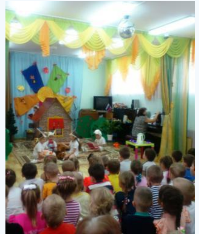
Вокально- танцевальный кружок «Ритмическая мозаика»