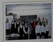
Ломоносову - 300 лет