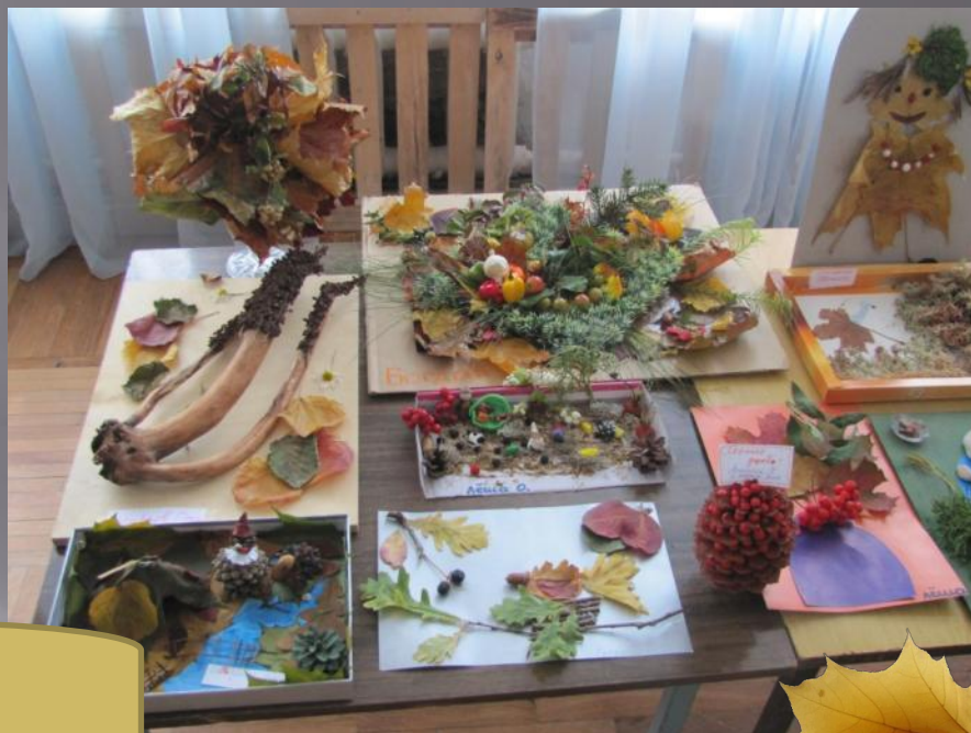
Ежегодная традиционная выставка «Золотая осень»