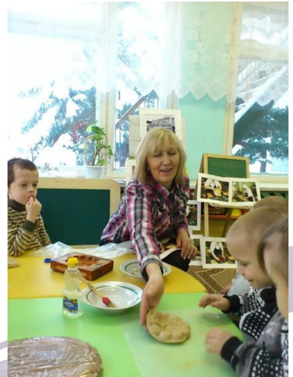
Взаимодействие с музеями