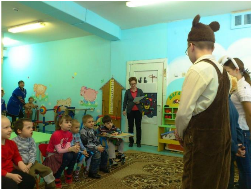
Взаимодействие с речевой школой