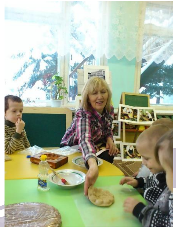
Взаимодействие с музеями