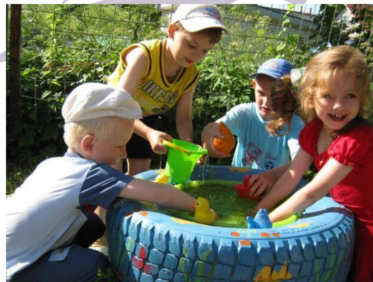
Занятия и игры с воспитателями