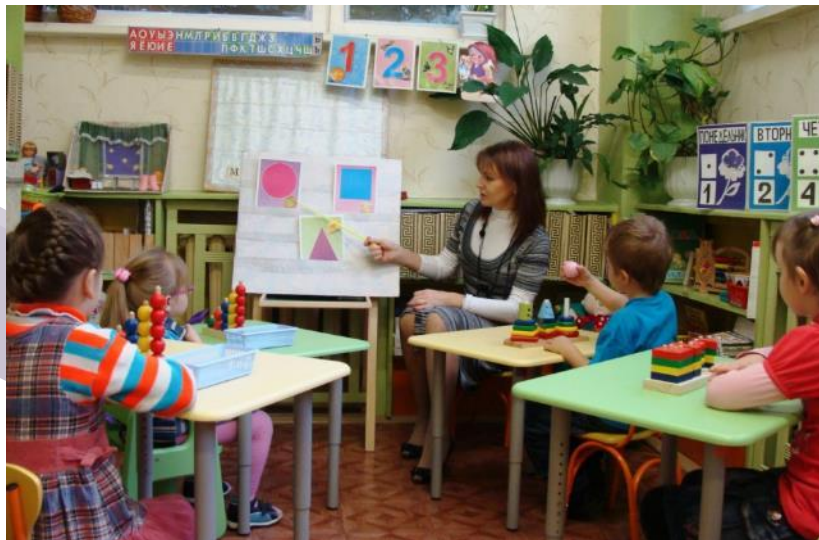
Занятие с учителем- дефектологом