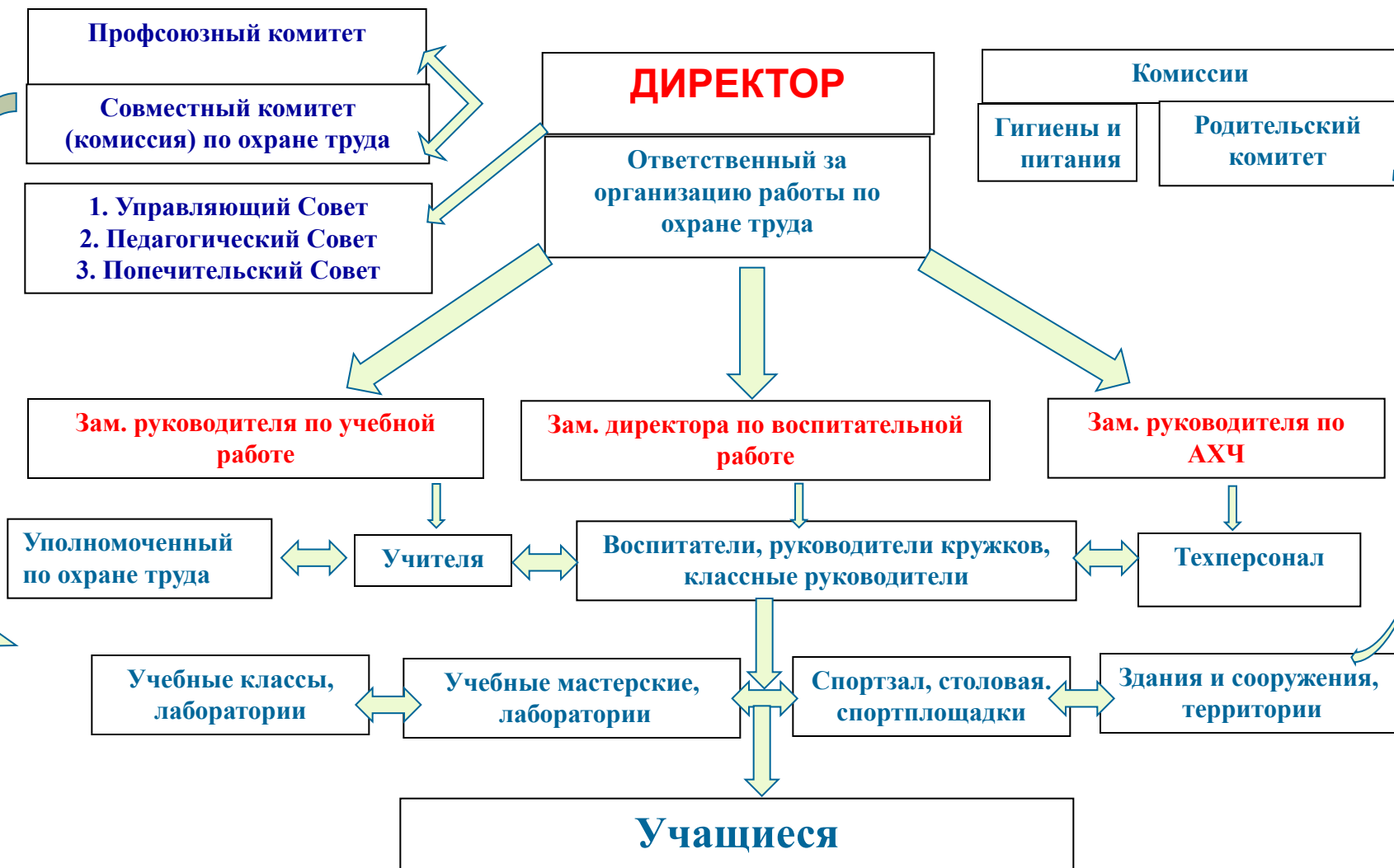
Схема управления охраной труда в школе