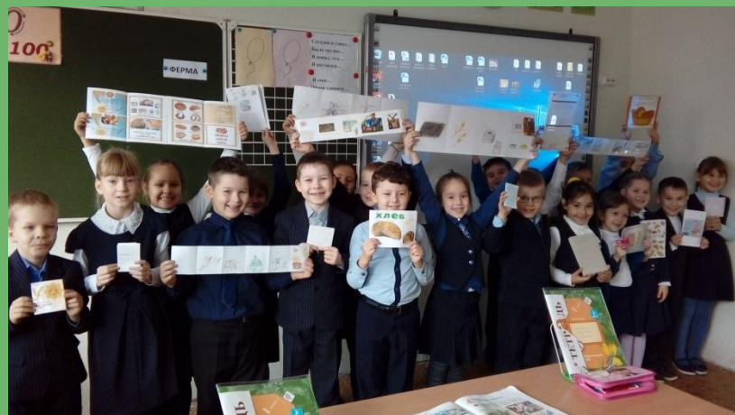
Откуда берётся хлеб