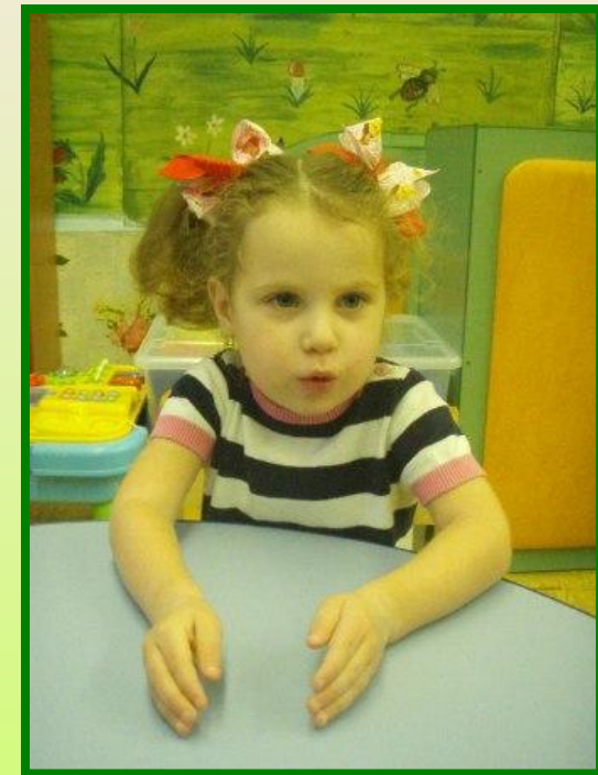
«Моя пила у-у- звонит....»