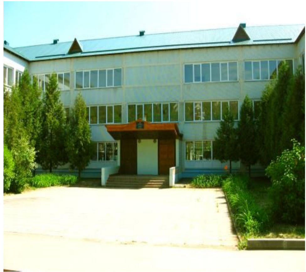
МОУ Лицей г. Истры.

Комфортные условия обучения, высокий уровень образования, эмоционально привлекательная, воспитывающая среда, яркие традиции – все это сделало Лицей востребованным для учащихся и их родителей.