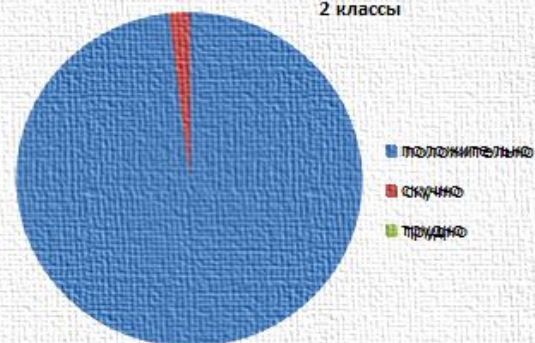
Оценка учащимися занятий внеурочной деятельностью 2014-2015 учебный год