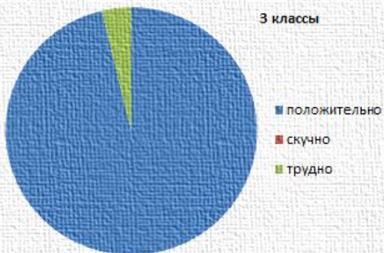
Оценка учащимися занятий внеурочной деятельностью 2014-2015 учебный год