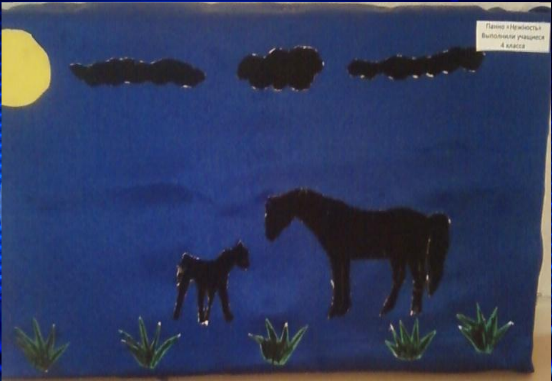
Панно «Нежность» Выполнили учащиеся 4 класса