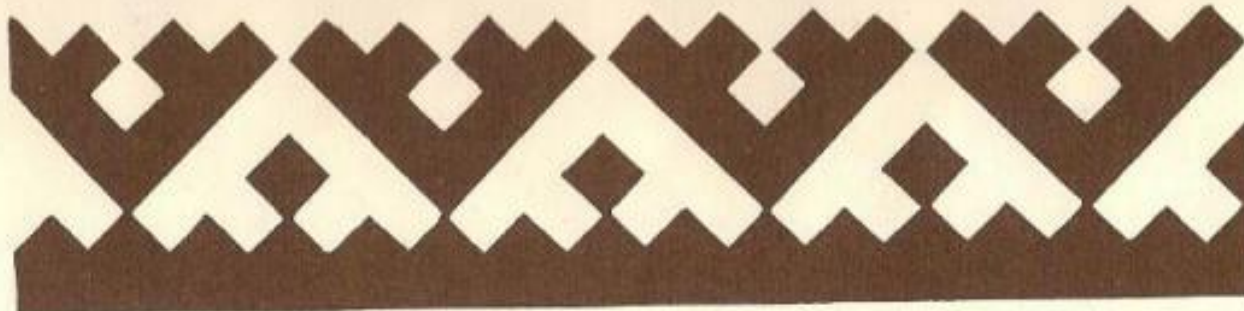
38. Сõвыр паль «Заячы ушки»