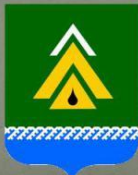
Герб Нижневартовского района