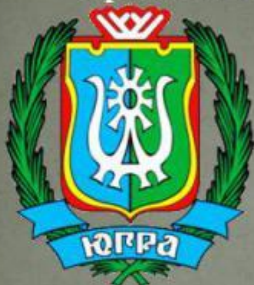
Герб Ханты-Мансийского АО