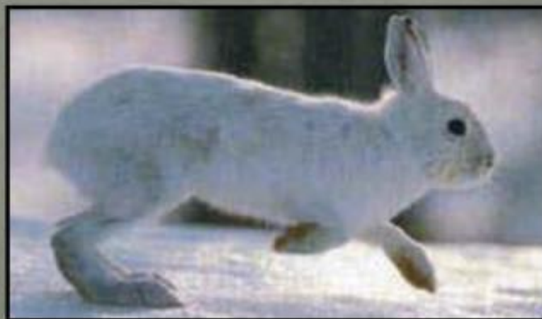
Чевар - заяц