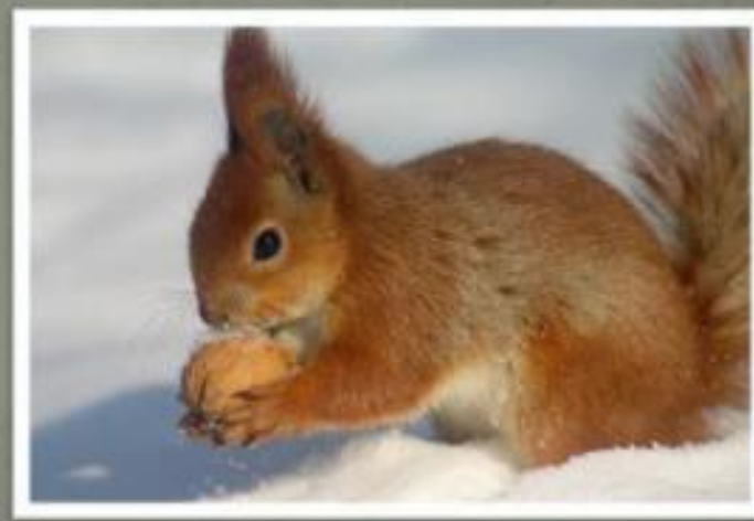
Ланки - белка