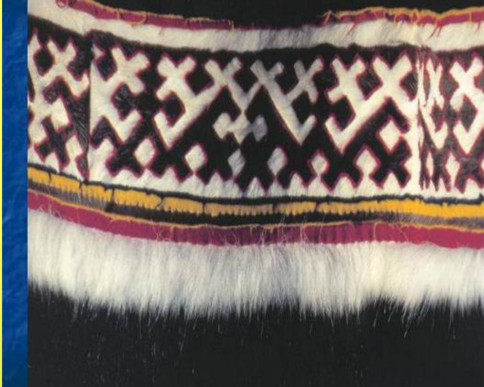
Фрагмент узора на женской меховой шубе.

Что же такое орнамент? Мы узнали, что орнамент - это узор из геометрических, растительных или животных элементов. Орнамент хантыйского народа богат и многообразен. Орнамент у этого народа "говорящий", каждый содержит в себе определенную информацию, что-либо обозначает и имеет свое название.