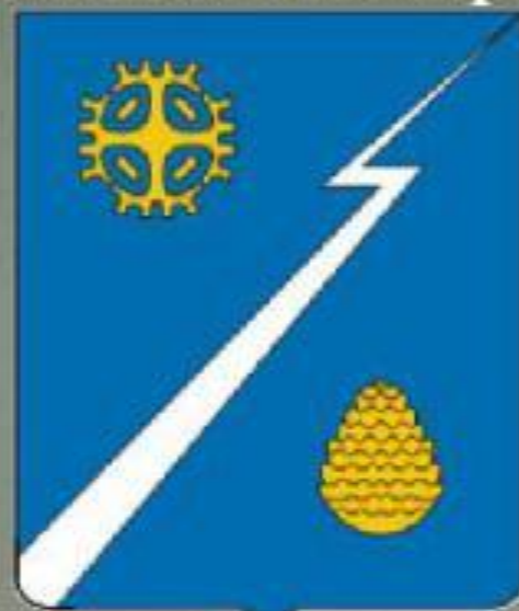
Герб г. Излучинска