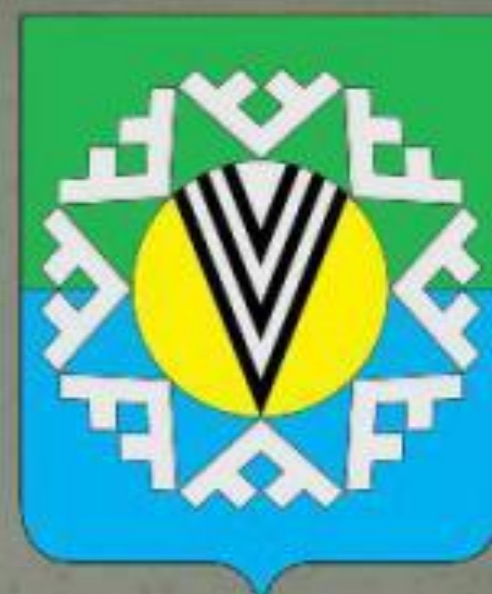
Герб пгт. Новоаганска