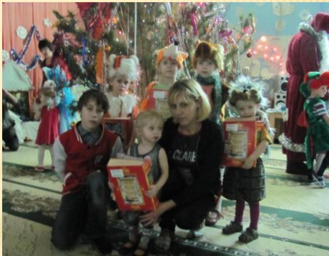
Семейная дошкольная группа №1

В организации функционирует 6 возрастных групп и 2 семейные дошкольные группы.