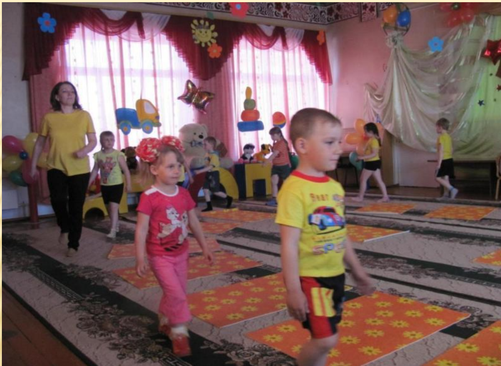
Семейная дошкольная группа №2 на спортивном празднике в ДОУ