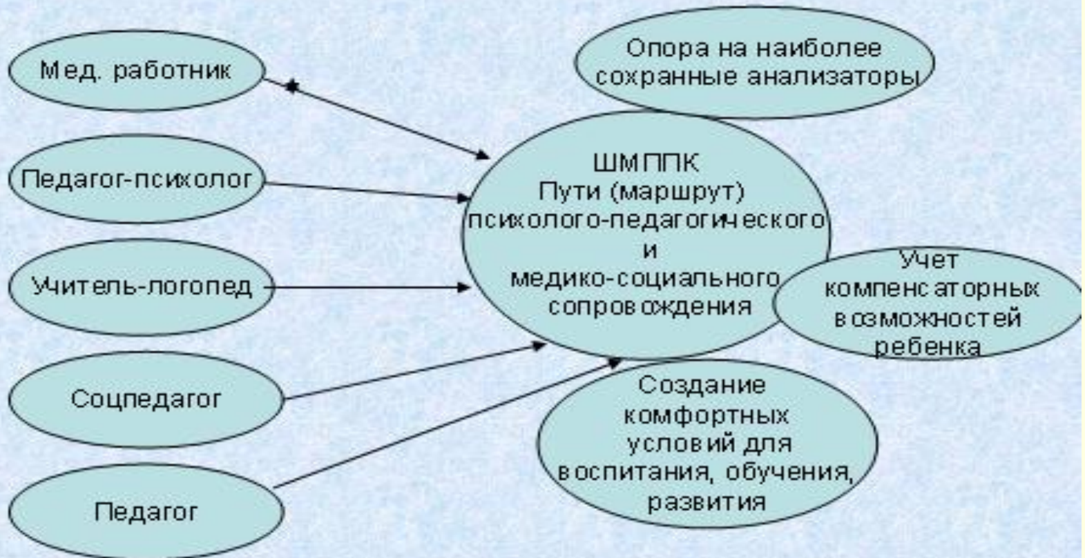
Схема сопровождения детей