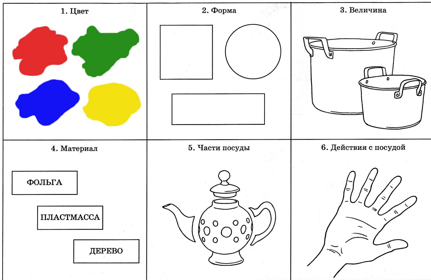
Схема описания и сравнения посуды