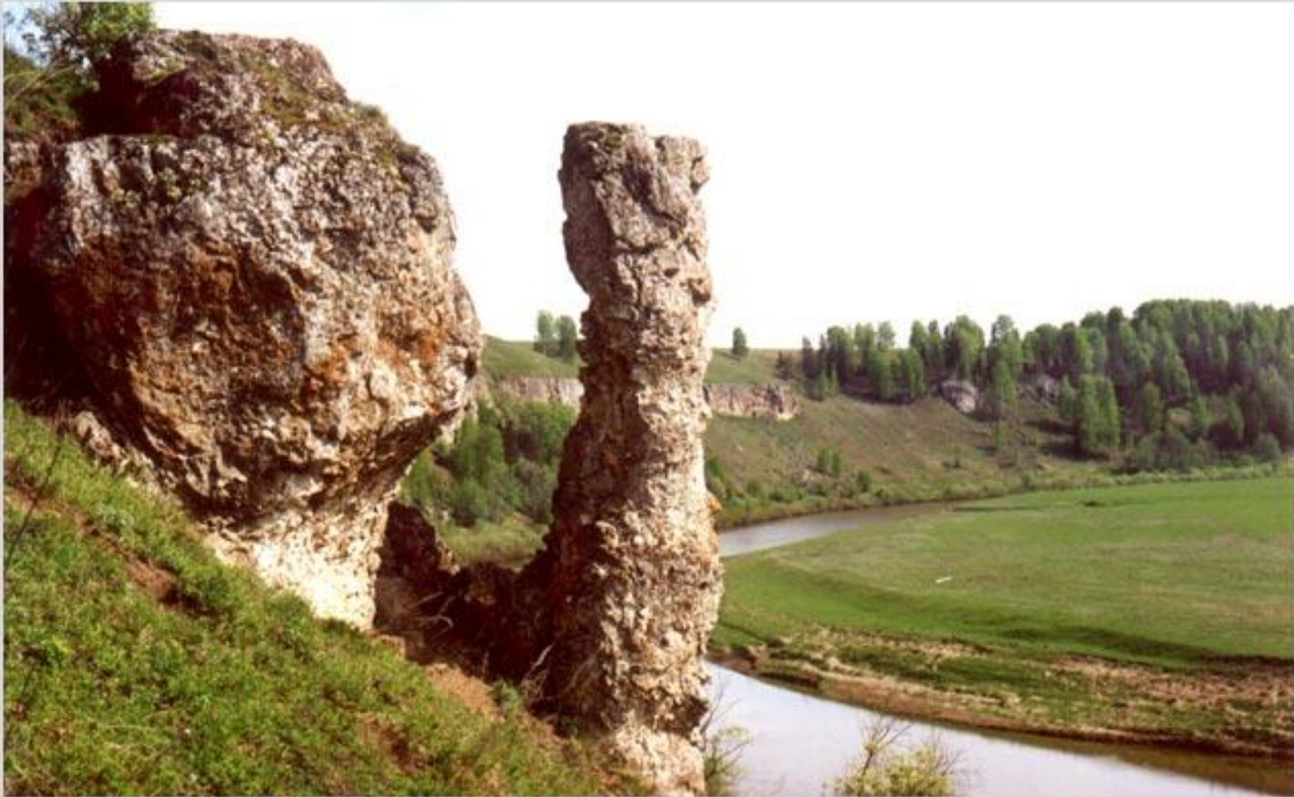
Скальный массив «Камень» Скала «Часовой»