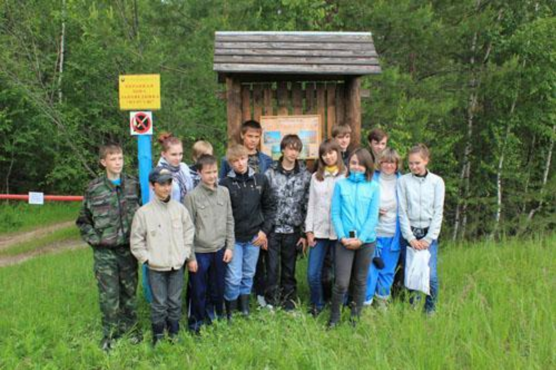
Школьники на экотропе