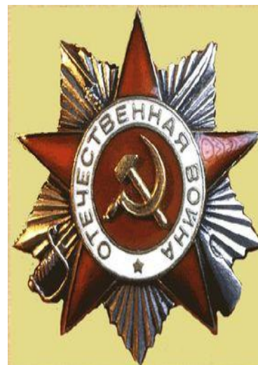
Орден Отечественной войны I степени

Сотни тысяч наших земляков отважно сражались за свободу родного города и родной страны. Подвиг воронежцев и Воронежа в Великой Отечественной войне позднее был отмечен высокими правительственными наградами: в 1975 город Воронеж был награжден орденом Отечественной войны I степени, в 1986 году – Орденом Ленина, в 2008 году Воронежу было присвоено почетное звание РФ «Город воинской славы». Великий подвиг совершили воронежцы в годы Великой Отечественной войны.