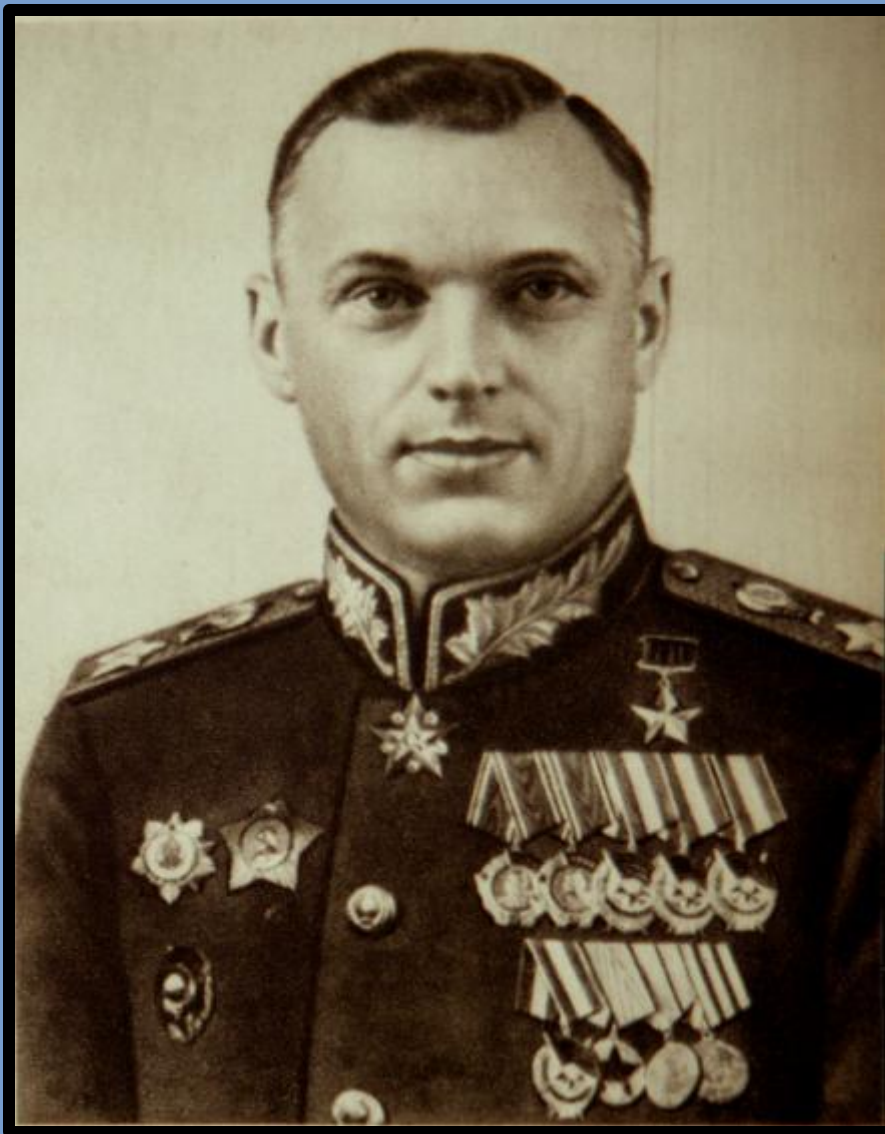
Константин Константинович Рокоссовский