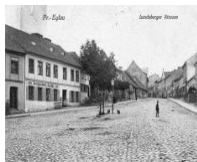
Ландсбергер штрассе. Фото 1930-х годов