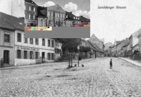
Прейсиш-Эйлау, Ландсбергер штрассе. Фото 1930-х годов