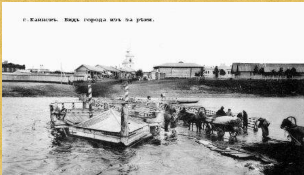
г.Каинскъ. Видъ города изъ за рѣки.

В 1733 году через форпост был проложен тракт в Тюмень иТобольск – главные центры Сибири на то время. Каинск- пас стал Каинском