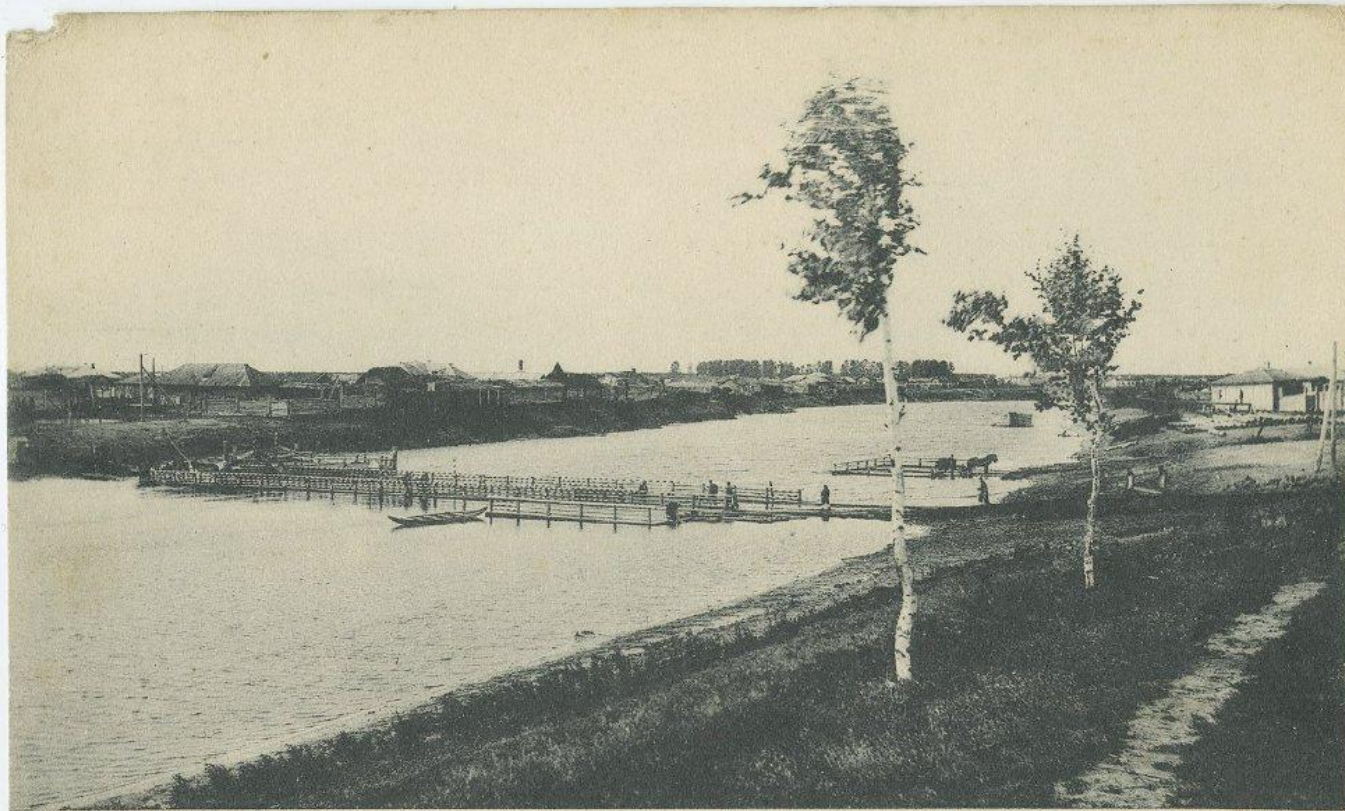
Гор. Каинскъ. Мостъ на рѣкѣ Каинкѣ и зарѣчная сторона.

Куирышев возник в 1722 году, и назывался он Каин-Тас, что в переводе с языка местных татарских племен означало «береза». Главной проблемой, с которой столкнулись казаки – постоянные набеги воинственных кыргызов и калмыков.