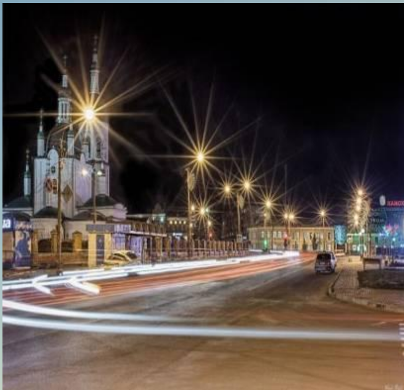
Правобережный район Спасский собор