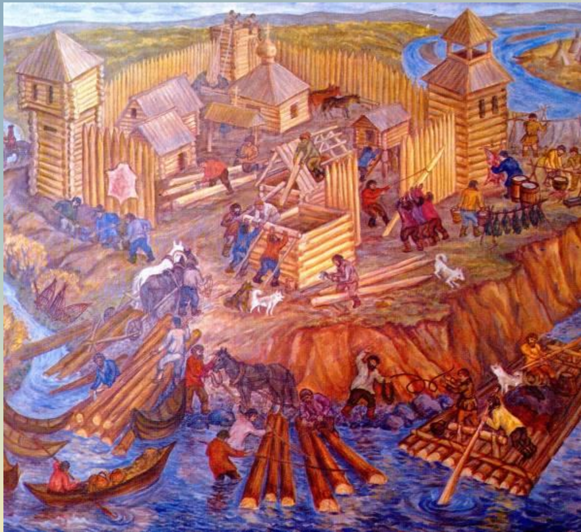
Капелько В.Ф. «Первопроходцы на реке Кан»