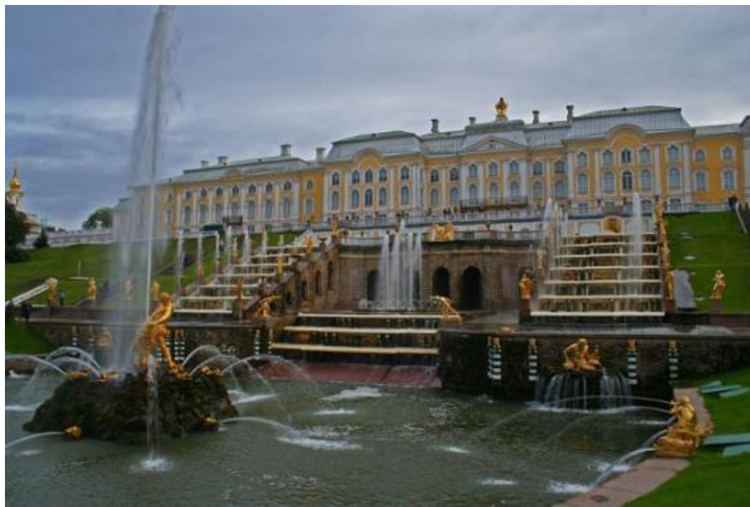
Петергофский дворец в Санкт-Петербурге.