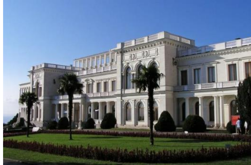
Ливадийский дворец - южная резиденция российских императоров в Крыму.