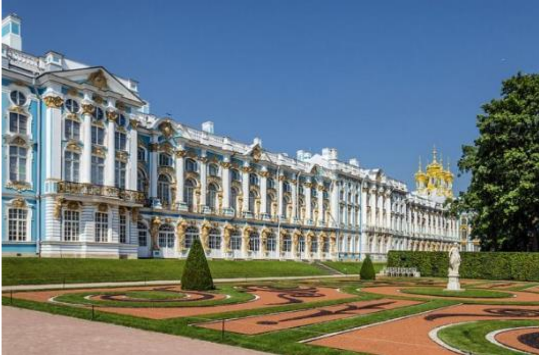
Большой Екатерининский дворец в Царском селе.