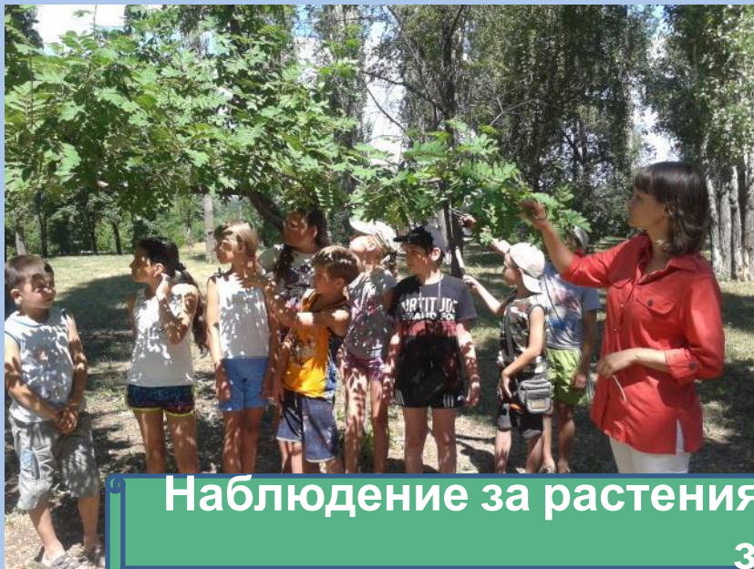
Наблюдение за растениями и насекомыми парковой зоны