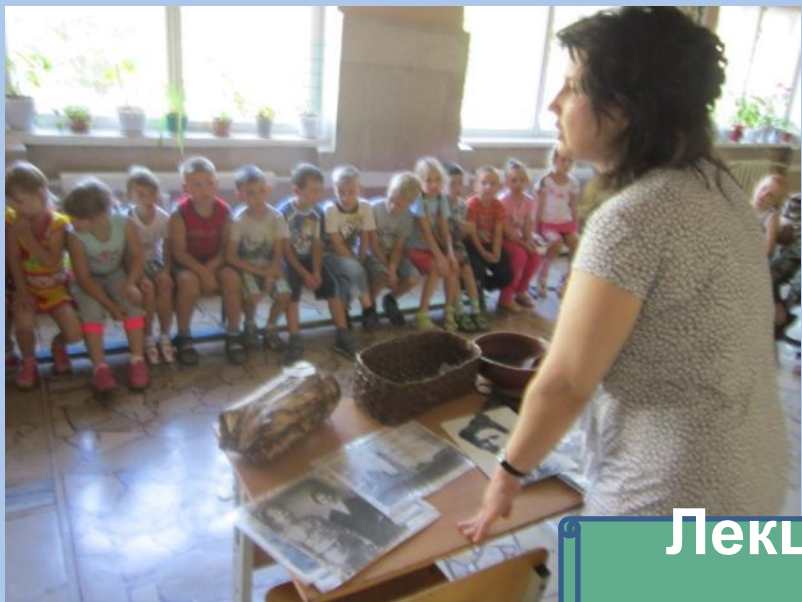
Лекция «Чапаев на балаковской земле»