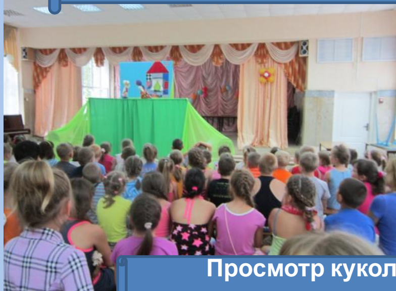
Просмотр кукольных спектаклей и театральных представлений