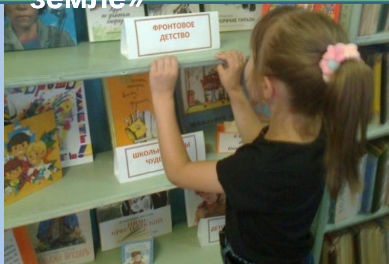
Беседа «Пылающий адрес войны»