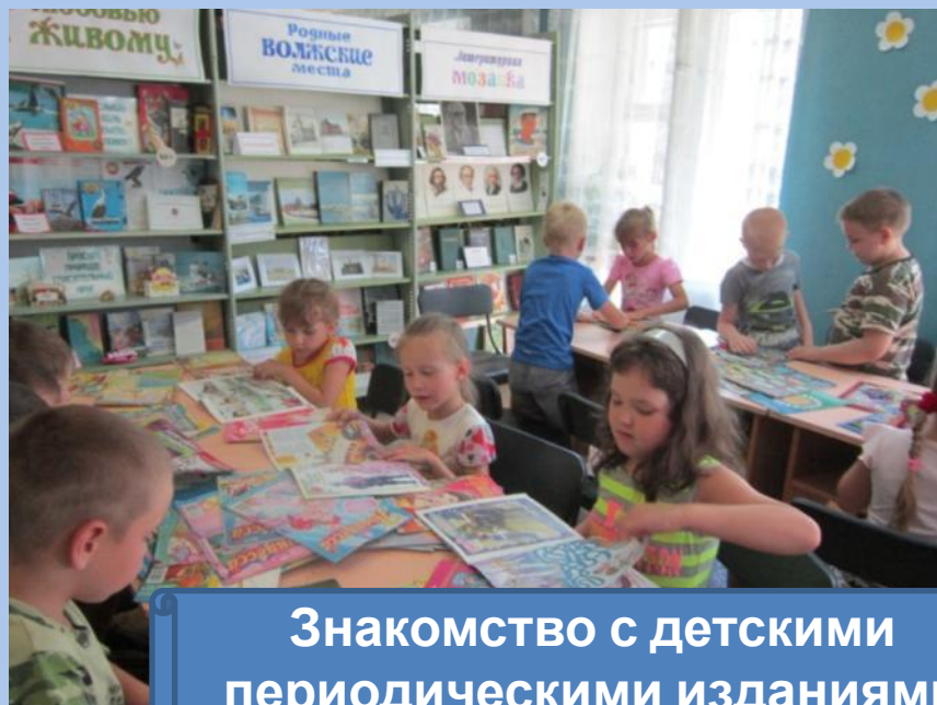
Знакомство с детскими периодическими изданиями