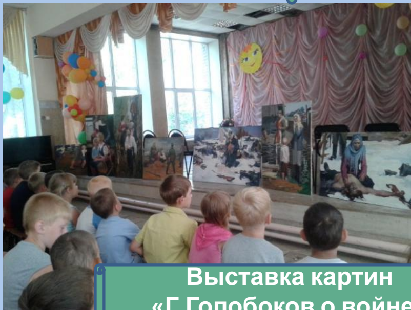
Выставка картин «Г.Голобоков о войне»