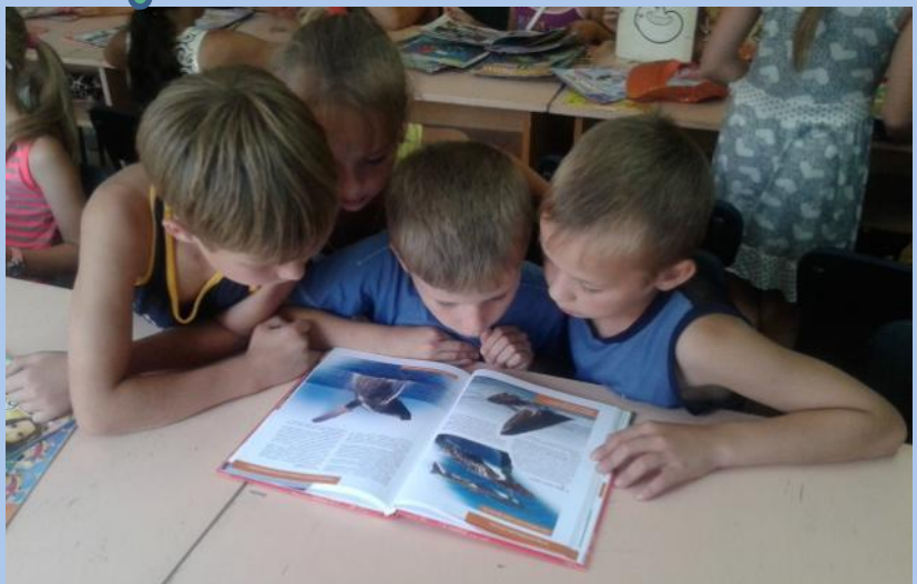
Час экологических познаний «Как не любить нам эту землю»