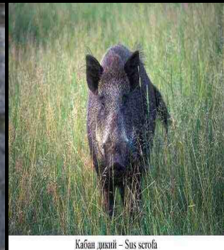
Кабан джунгли – Sus scrofa