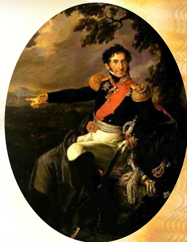
Багратион П. Р.