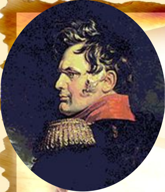
А П Ермолов