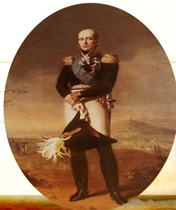
Барклай -де -Толли