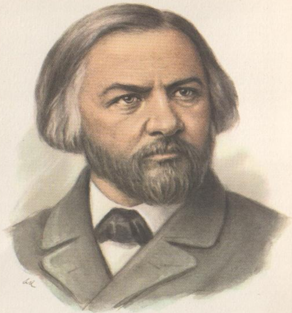
МИХАИЛ ИВАНОВИЧ ГЛИНКА