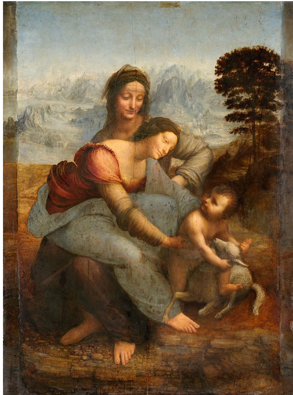
Леонардо да Винчи Мадонна втроем Материнство нуждается в материнстве