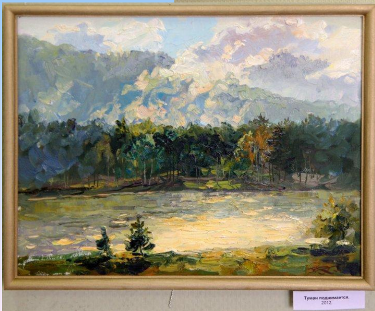
Туман поднимается. 2012.