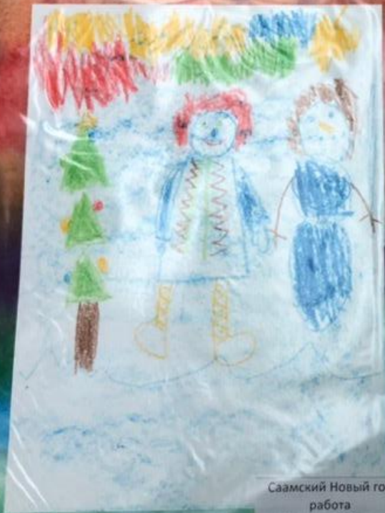
Саамский Новый год работа Шилиной Маши