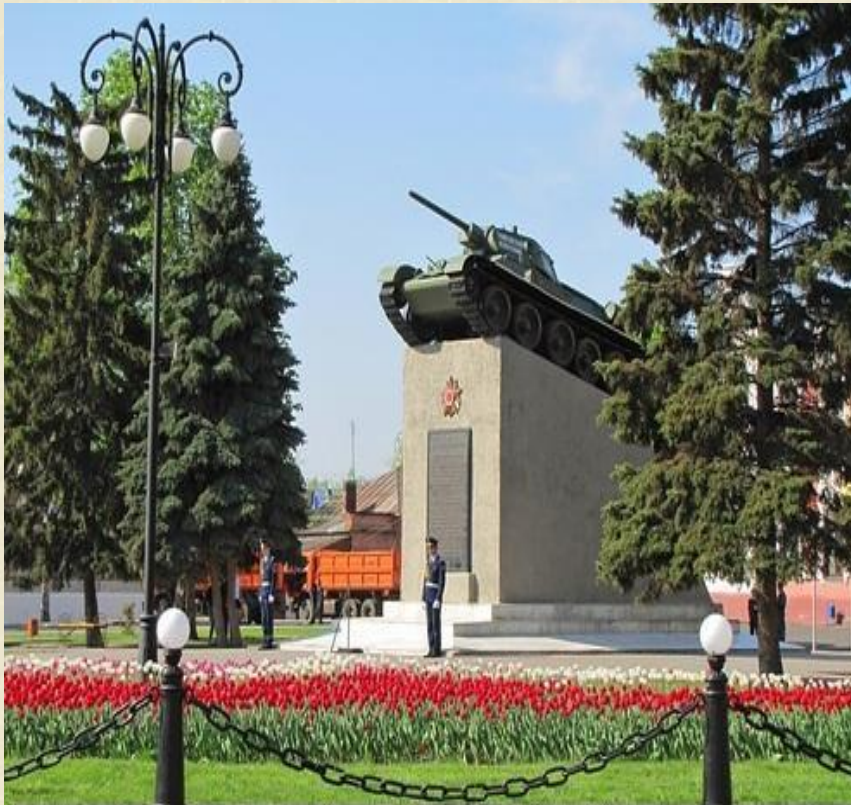
Рисунок 2 Памятник "Тамбовский колхозник"