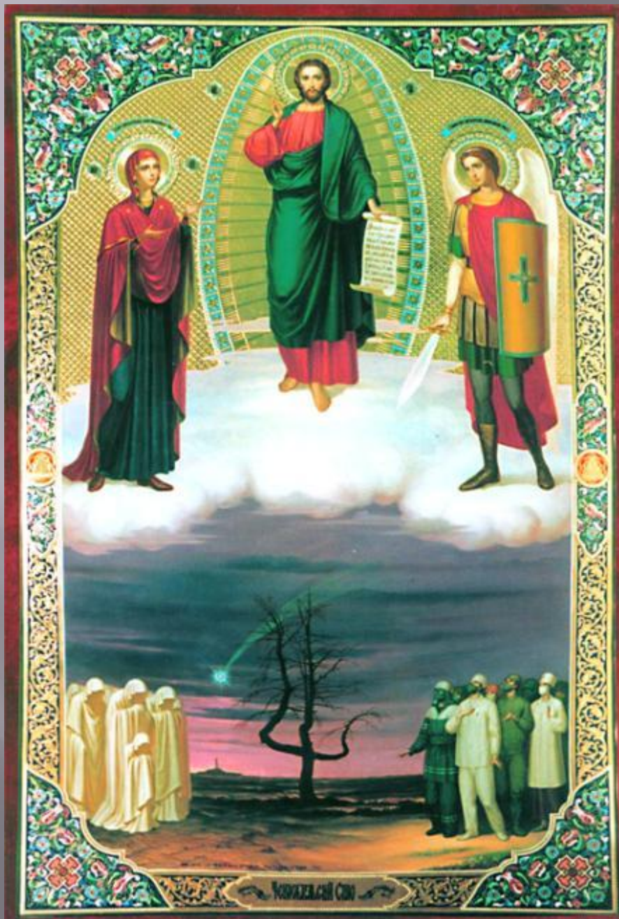
Икона «Чернобыльский спас»