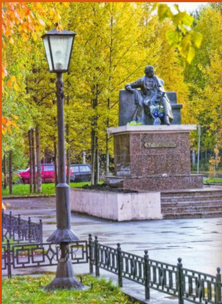
Памятник А.С. Пушкину