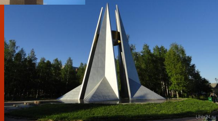
Памятный знак «Вечный огонь»