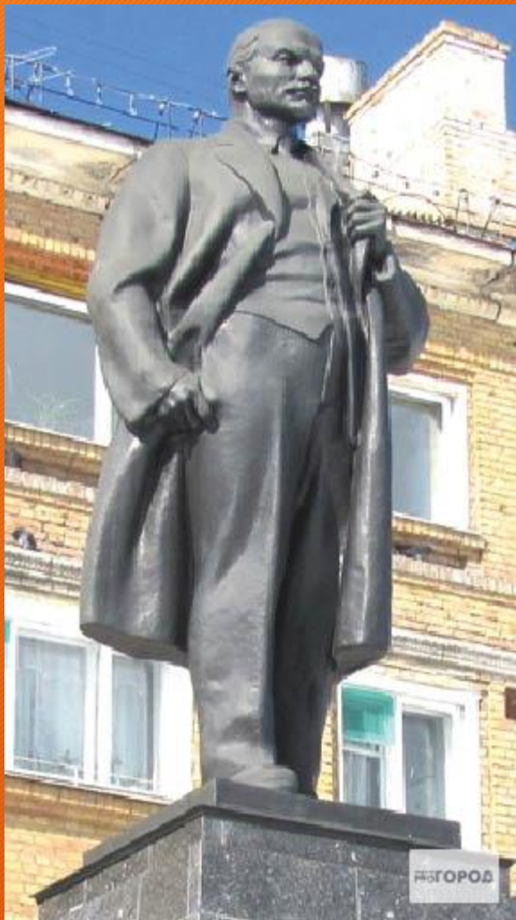
Памятник В.И. Ленину