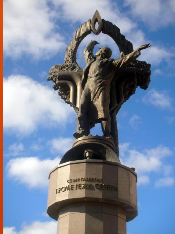
Памятник прометеям Севера