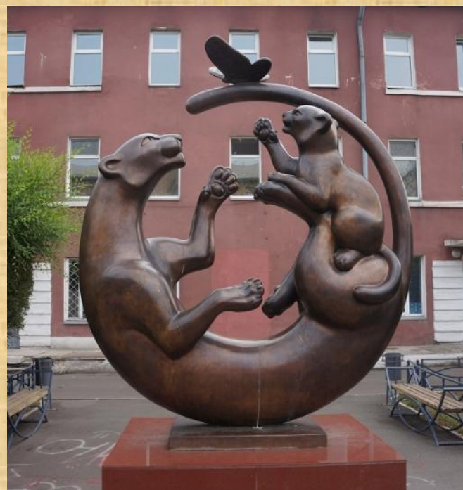
Скульптурная композиция «Нежность»