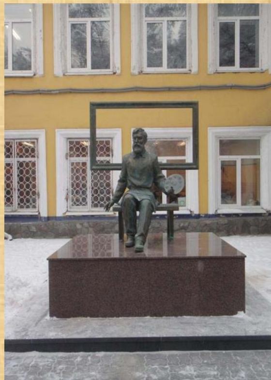
Памятник Д.И. Каратанову