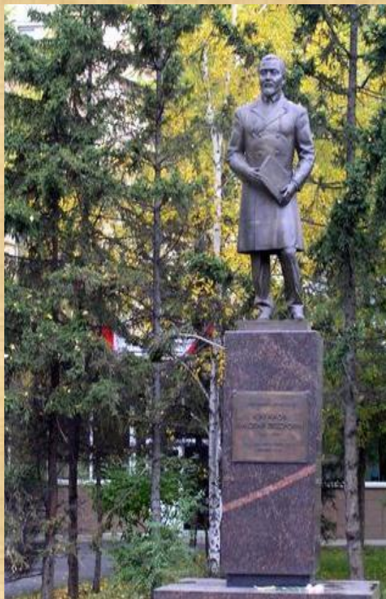
Памятник Н.Ф. Катанову