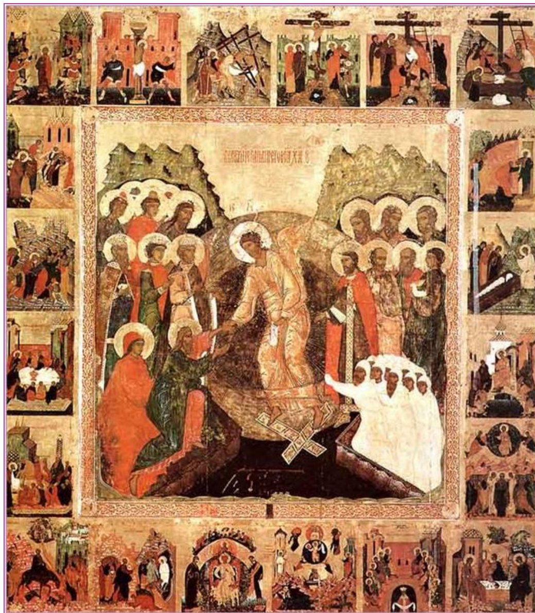
«Воскресение Христово» Вторая половина XVI века.