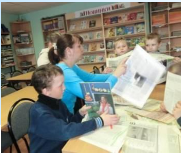
Знакомство с литературой о пасхе