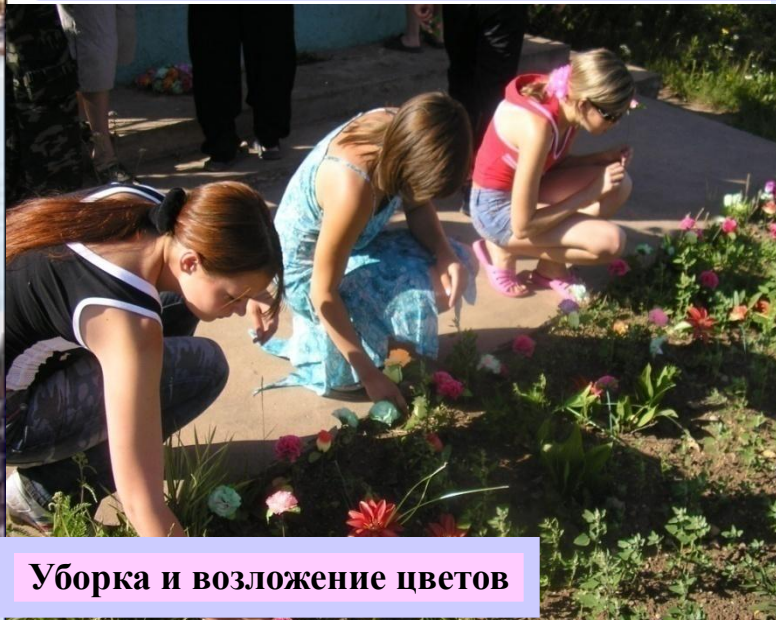
Уборка и возложение цветов