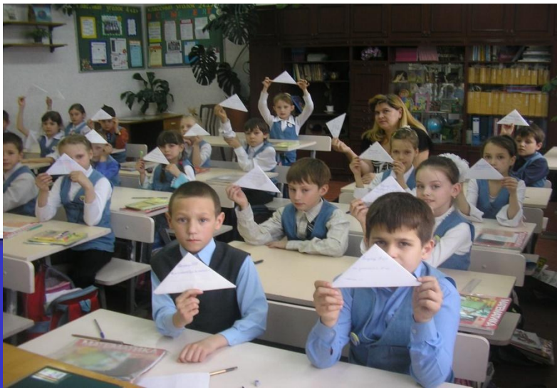
2 «А» изготовил открытки 2007г.