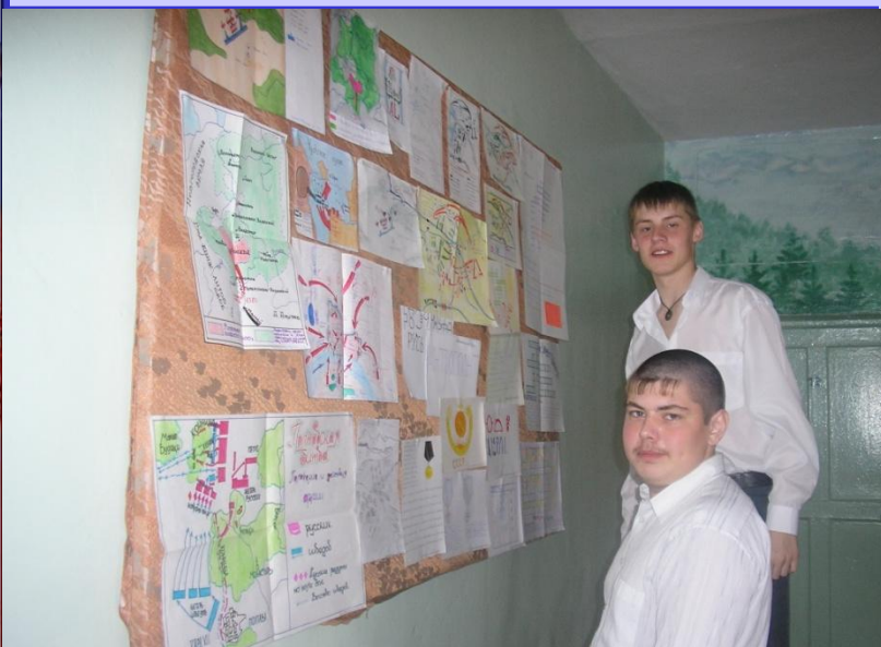
Подготовка к «Вахте памяти»

Традициями жива наша школа. В школе проходят :