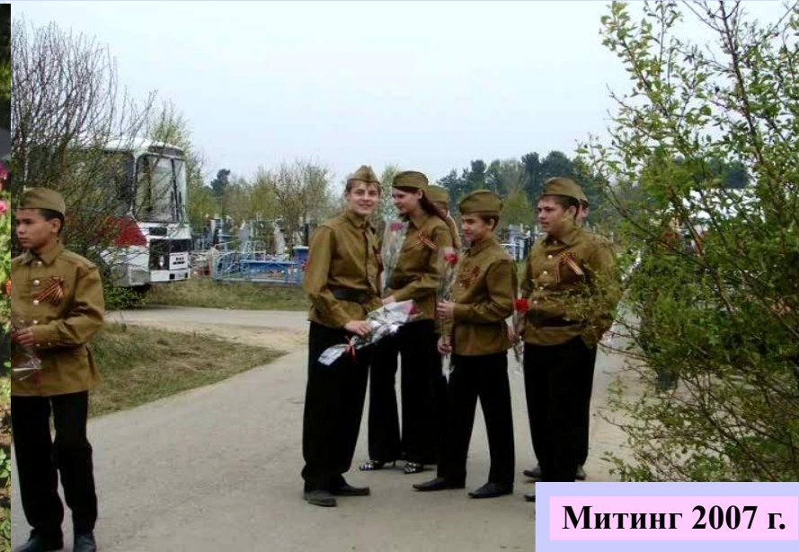
Митинг 2007 г.

Одним из главных направлений в работе отряда занимает Великая отечественная война. Проводиться работа с ветеранами ВОВ; Проведение школьной «Вахты памяти» с участием ветеранов; Уборка возле Обелиска Победы, ветеранских захоронений на шелеховском кладбище; Участие в митингах; Поздравление ветеранов .