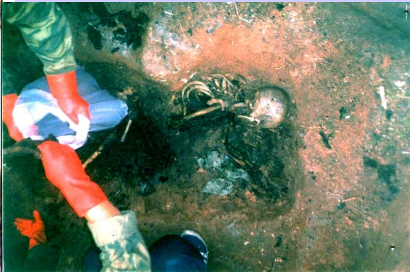
Поисковики проводят эксгумация погибших