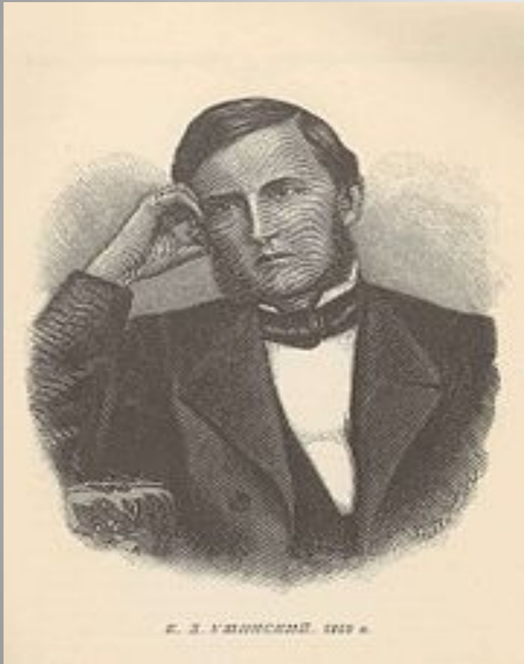
К.Д. Ушинский в 1859 г.