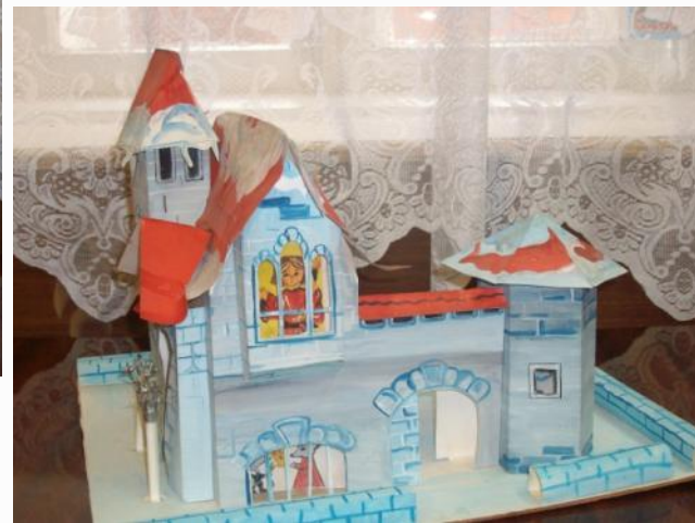
Замок Снежной королевы