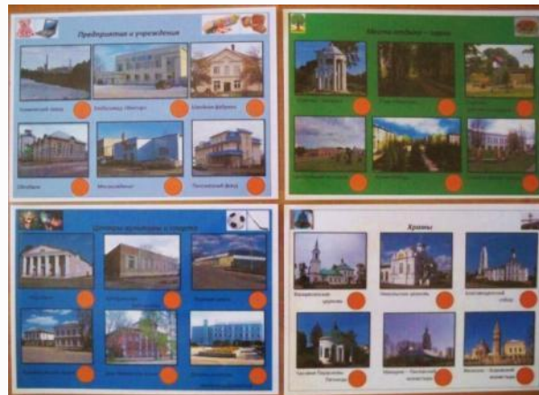
«Путешествие по городу Бую»