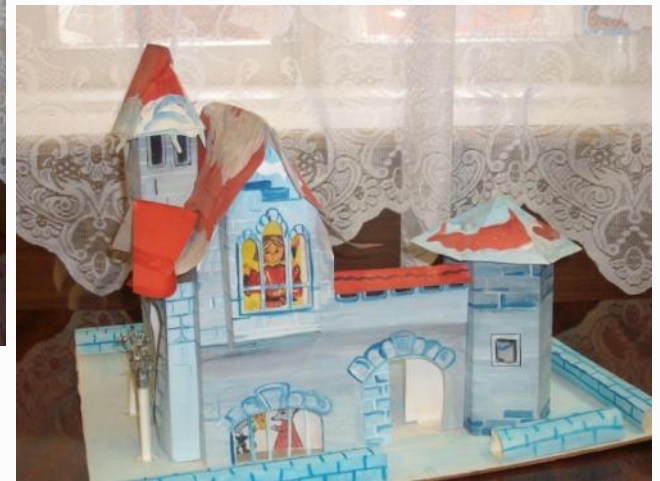
Замок Снежной королевы