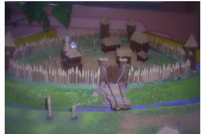
Древний город Буй – Крепость Буй