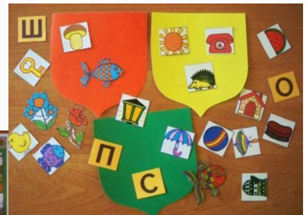
«Придумай свой герб»