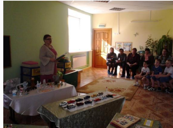
Дискуссия «Значение семейных традиций в нравственном воспитании дошкольников»