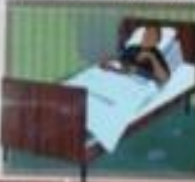
Иллюстрация: неосторожность при сну.