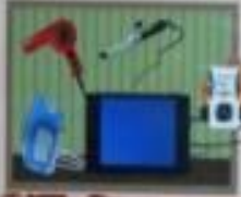
Иллюстрация: перегрузка электросетей.