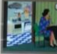
Иллюстрация: нарушение правил эксплуатации газовых и электрических приборов.

ПАРУШЕНИЕ ПРАВИЛ ЭКСПЛУАТАЦИИ ГАЗОВЫХ И ЭЛЕКТРИЧЕСКИХ