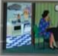
Иллюстрация: женщина сидит за столом, рядом с газовой плитой.

ПАРУШЕНИЕ ПРАВИЛ ЭКСПЛУАТАЦИИ ГАЗОВЫХ И ЭЛЕКТРИЧЕСКИХ ПРИБОРОВ