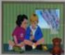
Иллюстрация: дети играют с спичками и свечой.