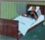
Иллюстрация: человек спит в кровати.