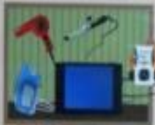
Иллюстрация: перегруженная электрическая розетка.