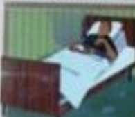
Иллюстрация: человек спит в кровати, рядом с зажженной сигаретой.