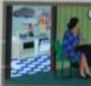
Иллюстрация: женщина сидит за столом, рядом с газовой плитой.

ПАРУШЕНИЕ ПРАВИЛ ЭКСПЛУАТАЦИИ ГАЗОВЫХ И ЭЛЕКТРИЧЕСКИХ