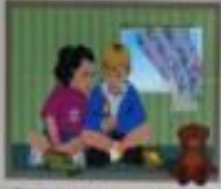
Иллюстрация: игра детей с спичками.