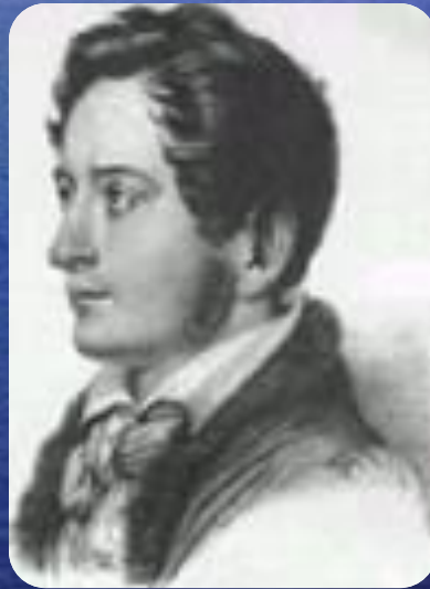
А.И. ГЕРЦЕН (1812-1870 Г.Г.)