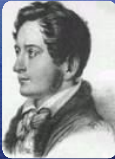
А.И. ГЕРЦЕН (1812-1870 Г.Г.)