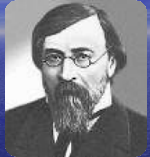
Н.Г. ЧЕРНЫШЕВСКИЙ (1828-1889 Г.Г.)