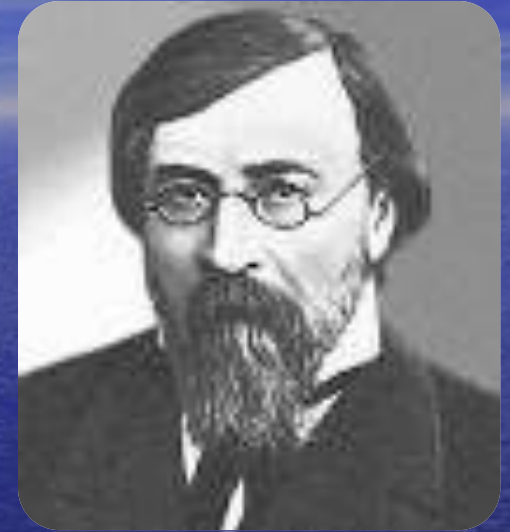
Н.Г. ЧЕРНЫШЕВСКИЙ (1828-1889 Г.Г.)