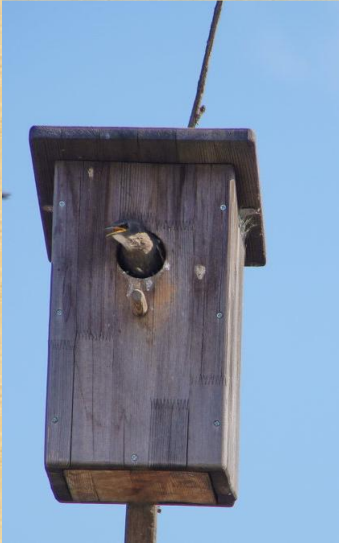
Скворец на скворечнике. (В)

Художник нарисовал картинки. Давайте рассмотрим их. Послушайте предложения и исправьте ошибки.