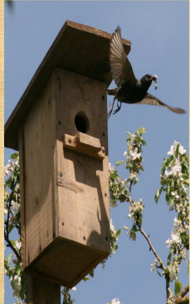
Скворец вылетел в скворечник.