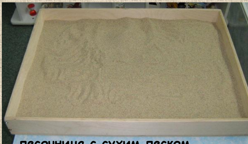
песочница с сухим песком размером 100 x 140 x 8 см.