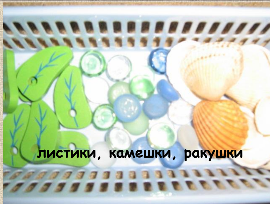
листки, камешки, ракушки