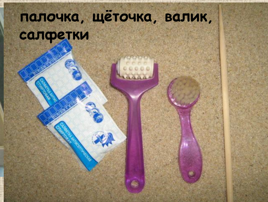
палочка, щёточка, валик, салфетки