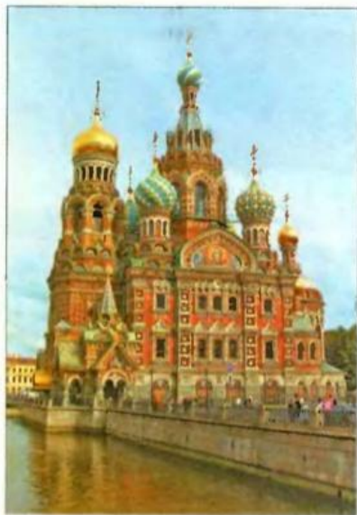
Город Санкт-Петербург — один из красивейших городов мира. Его часто называют второй столицей России.

На этих фотографиях показаны разные города и сёла России. Все они красивы, все интересны. И каждый город, каждое село — малая родина для кого-то из ребят и взрослых. Подготовьте фоторассказ о своей малой родине.