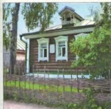
Село Константиново в Рязанской области — родина поэта Сергея Есенина.