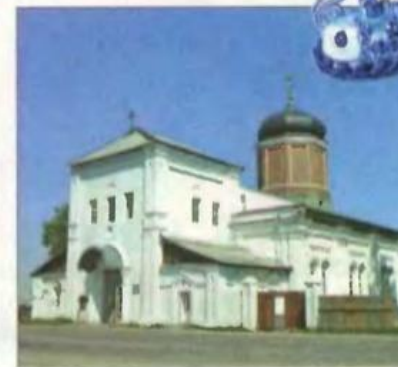
Село Гжель в Московской области славится знаменитыми изделиями из глины — гжельской керамикой.