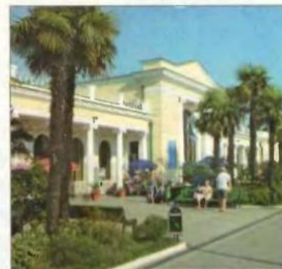
Город Сочи — город-курорт. Это место проведения зимних Олимпийских игр 2014 года.