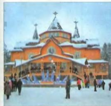
Город Великий Устюг — родина любимца детей и взрослых Деда Мороза. Здесь расположена его резиденция.